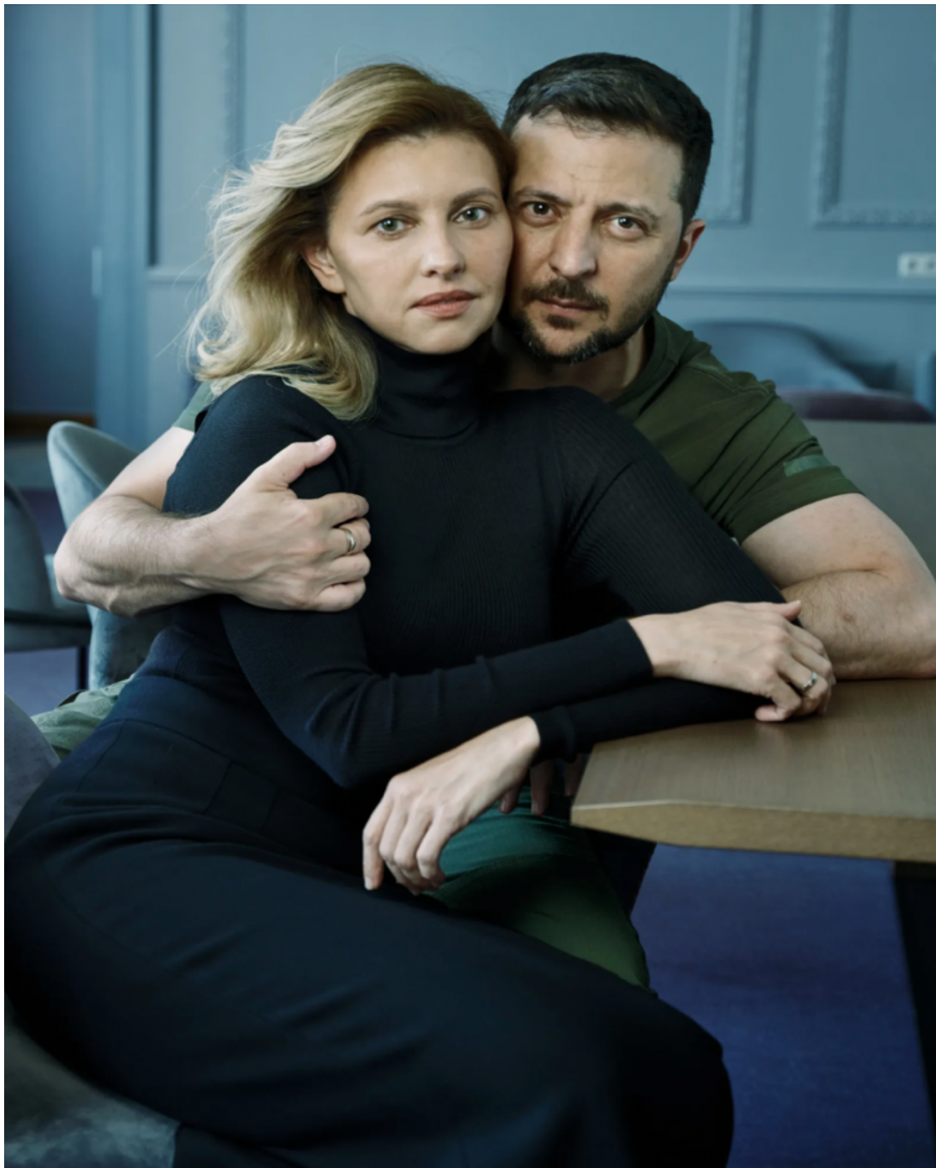
Портрет храбрости: первая леди Украины Елена Зеленская. (26 июля, журнал The Vogue )