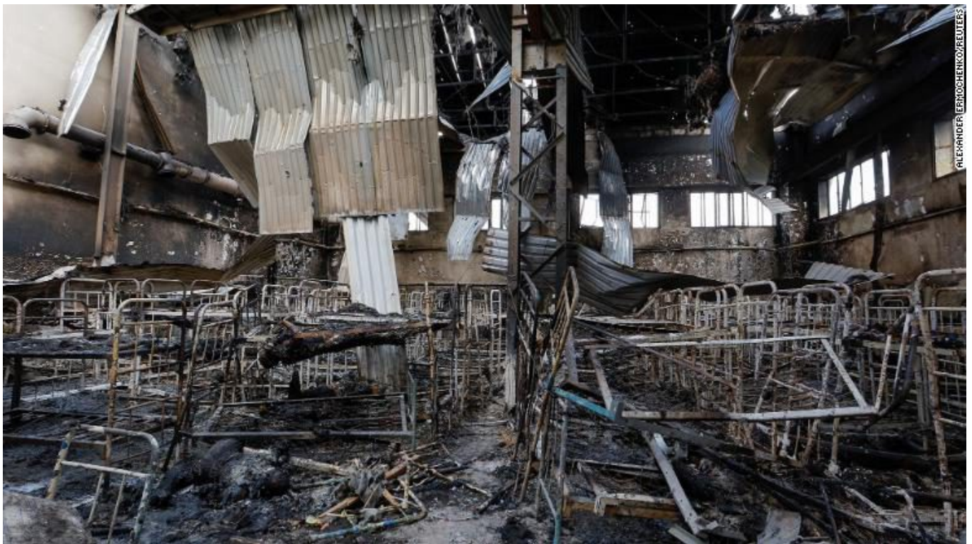
Интерьер следственного изолятора в поселке Еленовка Донбасской области. (29 июля, CNN , фото Александра Ермоченко, Reuters)