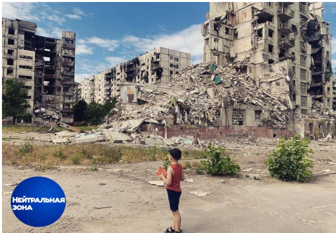
Мариуполь сегодня / Mariupol today (31 июля, Telegram-канал Neutral zone )