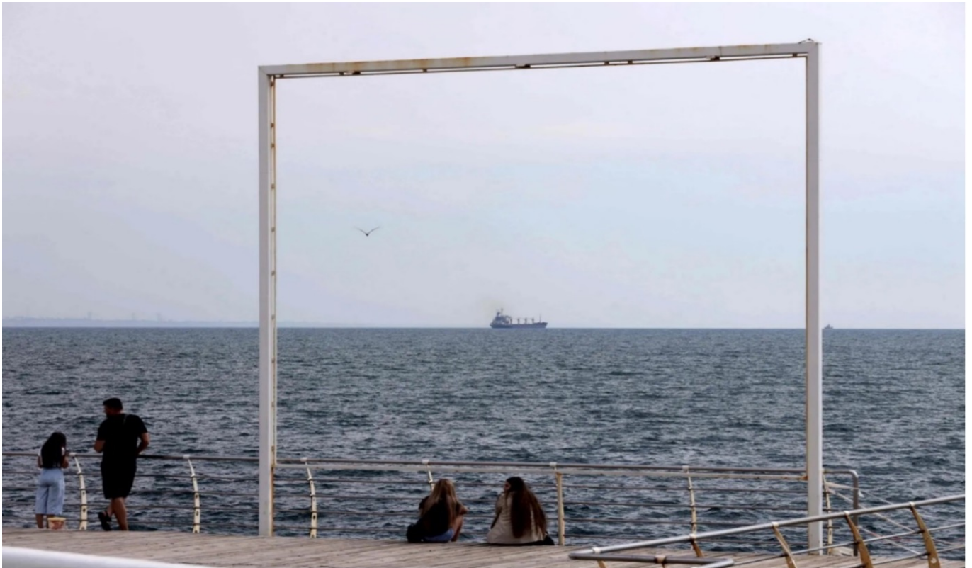
Судно "Разони", груженное кукурузой, вышло из Одессы в понедельник, став первым зерновым судном, покинувшим Украину за последние месяцы. (1 августа, New York Times)