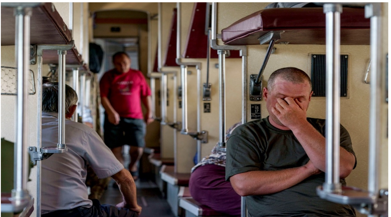
Пассажир сидит в эвакуационном поезде, ожидающем отправления из Покровска на востоке Украины на запад, в более безопасную часть страны, 2 августа. Он один из 5,5 миллионов внутренне перемещенных лиц в Украине, согласно докладу Международной организации по миграции.