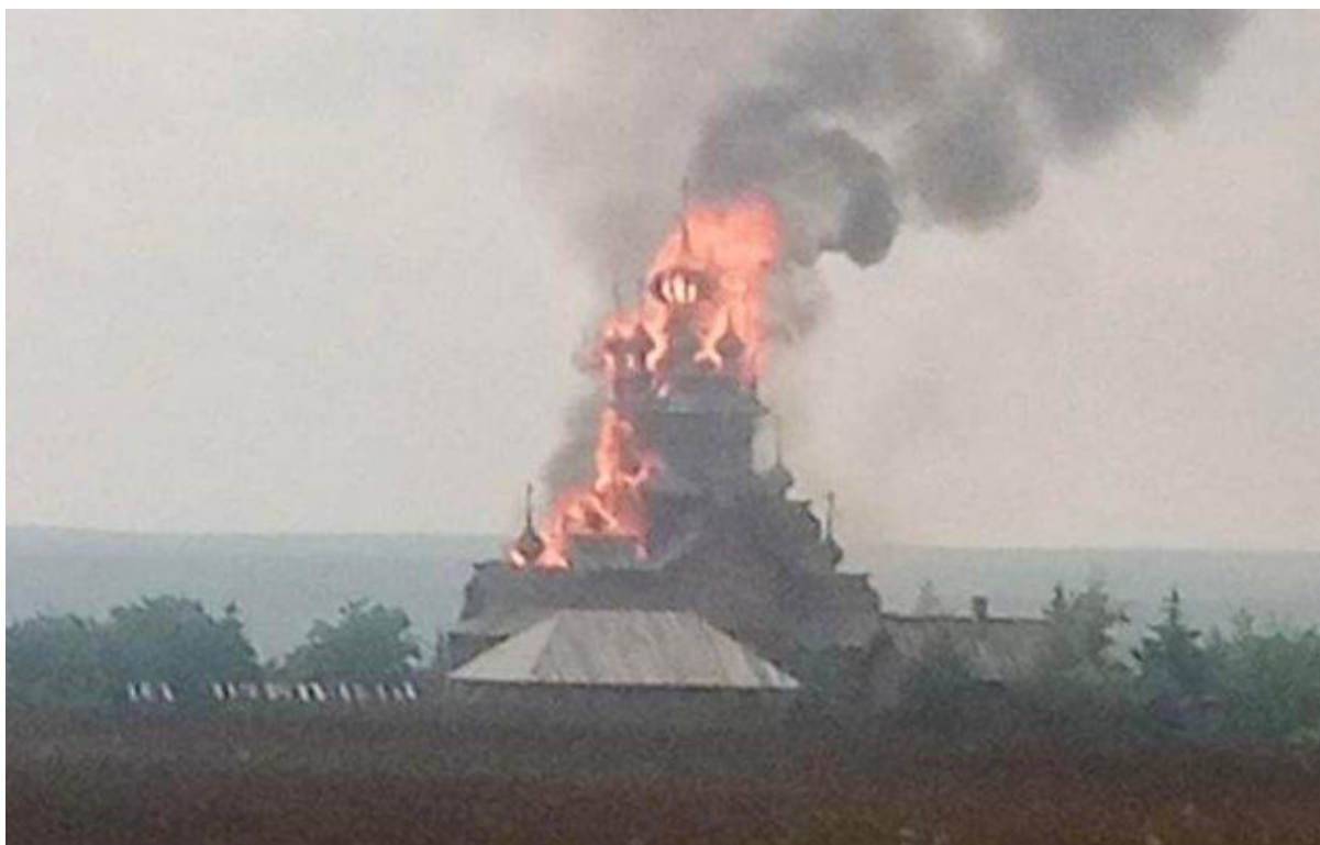
Горит деревянный скит (церковь) святых в Святогорской лавре ( Твиттер-аккаунт миссии Украины при ОБСЕ).