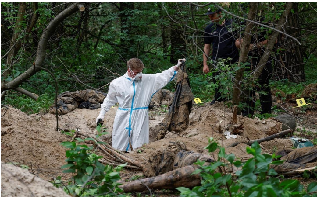
Судмедэксперт осматривает предполагаемое массовое захоронение возле села Ворзель, Бучанский район, Киевская область. (13 июня, Валентин Огиренко/Рейтерс)